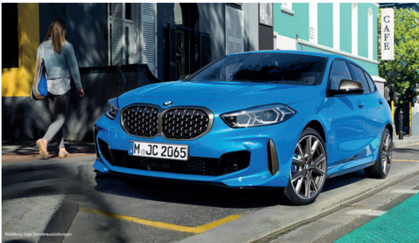
Abbildung zeigt Sonderausstattungen.